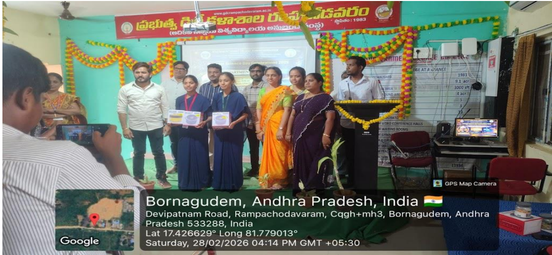
Bornagudem, Andhra Pradesh, India Devipatnam Road, Rampachodavaram, Cqgh+mh3, Bornagudem, Andhra Pradesh 533288, India Lat 17.426629° Long 81.779013° Saturday, 28/02/2026 04:14 PM GMT +05:30