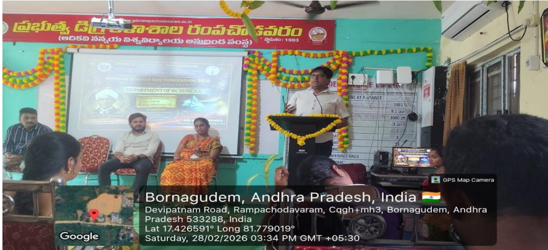
Bornagudem, Andhra Pradesh, India 🇮🇳 Devipatham Road, Rampachodavaram, Cqgh+mh3, Bornagudem, Andhra Pradesh 533288, India Lat 17.426591° Long 81.779019° Saturday, 28/02/2026 03:34 PM GMT +05:30