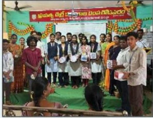
కార్యక్రమంలో పాల్గొన్న ప్రిన్సిపాల్, సిబ్బంది

రంపచోడవరం, (ఆంధ్రప్రభ): శనివారం రంపచోడవరం ప్రభుత్వ డిగ్రీ కళాశాలలో జాతీయ విజ్ఞాన దినోత్సవం ఘనంగా నిర్వహించబడింది. ఈ సందర్భంగా ప్రశ్నోత్తరాల పోటీ (క్విజ్), ప్రదర్శన పత్రాల సమర్పణ (పవర్ పాయింట్ ప్రజెంటేషన్), సైన్స్ సాంకేతిక ప్రదర్శన (సైన్స్ ఎగ్జిబిషన్), మరియు రంగవల్లి పోటీలు నిర్వహించ