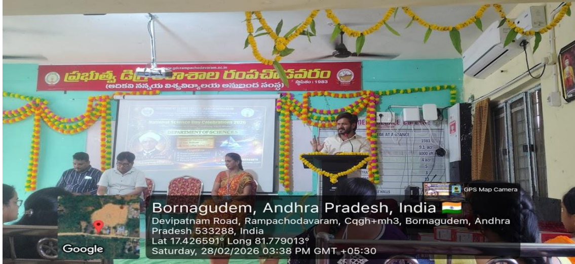
Bornagudem, Andhra Pradesh, India Devipatnam Road, Rampachodavaram, Cqgh+mh3, Bornagudem, Andhra Pradesh 533288, India Lat 17.426591° Long 81.779013° Saturday, 28/02/2026 03:38 PM GMT +05:30